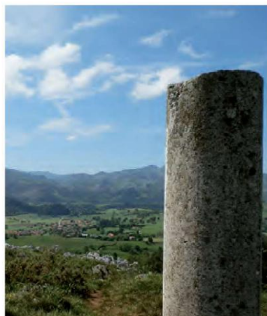
Navajeda desde el Pico Vizmaya (247 m)

Tras 500 m de descenso entre eucaliptos, la pista asciende hasta un pequeño alto (8) donde se abre un claro. Un poco más abajo, se atraviesa un bosque de encinas, para acabar llegando a la carretera (9) que lleva a Santa Marina. Aquí se continúa por ella en la dirección de la marcha (SO), para pronto llegar a un cruce en el B° El Risco donde se gira a la derecha. Sin desviarse y tras 700 m se llega al final del recorrido.