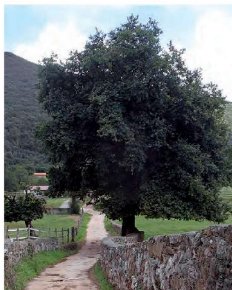
Valle de Manás

La ruta comienza en la Iglesia (1) del Barrio de Iseca Nueva, en dirección sur hacia la autovía A-8. Al final de la calle se cruza un puente y se sigue a la derecha (0), todavía por asfalto. Al poco, se llega a una casa que se deja a la derecha tomando una pista más estrecha, de cemento en los primeros metros y de grijo después. Esta pista conduce a la base de uno de los puentes de la A-8 (2), allí se cruza con una carretera, que se toma durante 50 m para luego coger otra pista de grijo, que gana altura rápidamente, dejando atrás unas bonitas vistas del poljé de Liendo. Esta pista conduce al escondido valle de Manás, se sigue por ella hasta un cruce (3) en el que se gira a la izquierda (E). La ruta atraviesa una zona llana flanqueada con muros de piedra, que encierran prados y explotaciones dedicados a la cría de caballos. Continuar unos 300 m, para luego (4) girar a la izquierda (N) y seguir por la pista hasta encontrar un cruce (5) donde se toma el camino de la derecha (SE). De este camino no habrá que desviarse hasta el final del recorrido. Tras aproximadamente 1 km y seguido a una ligera subida, se abandona el valle de Manás (6), para después atravesar un pequeño valle ciego (7), custodiado en su flanco este por la peña de las Abejas. El camino hace un giro de izquierdas y comienza a ganar pendiente hasta salir del valle (8). En este momento se abandonan los prados, el ganado y el municipio de Liendo, para dar paso a