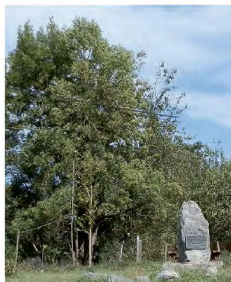
Monumento de la guerra Carlista (9)

sale a la derecha (SO). Más adelante, ya por un camino más ancho, se pasa una valla. Aquí el camino se convierte en pista asfaltada, que será el firme sobre el que se camine hasta el final del recorrido. Enseguida se bifurca (8) y se gira a mano izquierda (N), para continuar descendiendo por ella sin desviarse hasta pasar el punto limpio, y luego seguir por la izquierda (NE) para llegar al barrio de Guardamino, donde se continúa por la pista de la derecha (9).