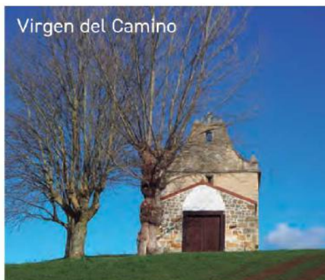
Virgen del Camino

(3). Al terminar la bajada, giraremos a la izquierda (4) y nos encontramos el ayuntamiento de Ribamontán al Monte y la iglesia de Nuestra Señora María de Toraya (5). Al pasar la iglesia giraremos a la izquierda (6) y comenzaremos la subida hacia la ermita de la Virgen del Camino. Esta parte es lo más duro del recorrido ya que durante un kilómetro subiremos hacia la ermita con zonas de pendiente fuerte, por ello se aconseja hacerlo despacio. En la parte alta nos encontramos otra pista, iremos a la izquierda (7) para ver la ermita y las vistas que hay desde el punto geodésico de Santander (8). Al bajar de la ermita iremos de nuevo a la izquierda para seguir la pista que va en dirección las Pilas (9), recorreremos un poco menos de 1,5 km para tomar una pista a la derecha (10) que nos bajará al barrio de Laza. La pista de bajada es entre castaños que lo convierte en un paisaje muy bonito. Al acabarla giraremos a la derecha (11) en dirección ya de vuelta al ayuntamiento y desde allí sólo faltaría el último kilómetro hasta alcanzar el aparcamiento.